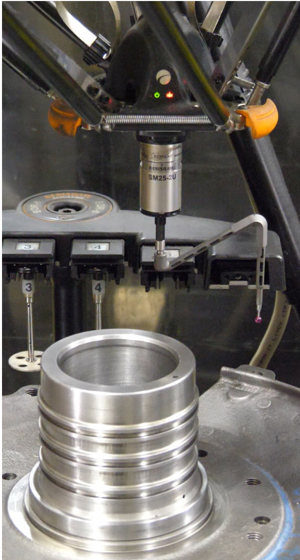
Inspectie van een autocomponent op een Equator 300 met additief geproduceerde stylus

De Equator 300 scant componenten met snelheden tot ruim 200 mm/s, behoudt zijn hoge nauwkeurigheid in een temperatuurgebied van 5 °C tot 50 °C, en leverde Linex Manufacturing een veelzijdig inspectievolume van 300 mm diameter bij een hoogte van 150 mm voor een maximaal productgewicht van 25 kg.