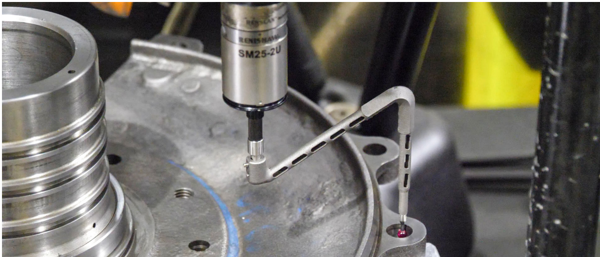
Op een RenAM 500Q systeem 3D metaalgeprinte stylus op maat

Een paar jaar later was de oorspronkelijke AM stylus nog steeds in gebruik zonder enige vermindering van zijn prestaties. Linex kocht een tweede AM stylus in exact dezelfde uitvoering, en nu werkt het bedrijf met zes Equator 300 systemen en één grotere Equator 500.